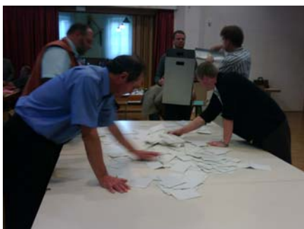
Auszählung der Stimmen